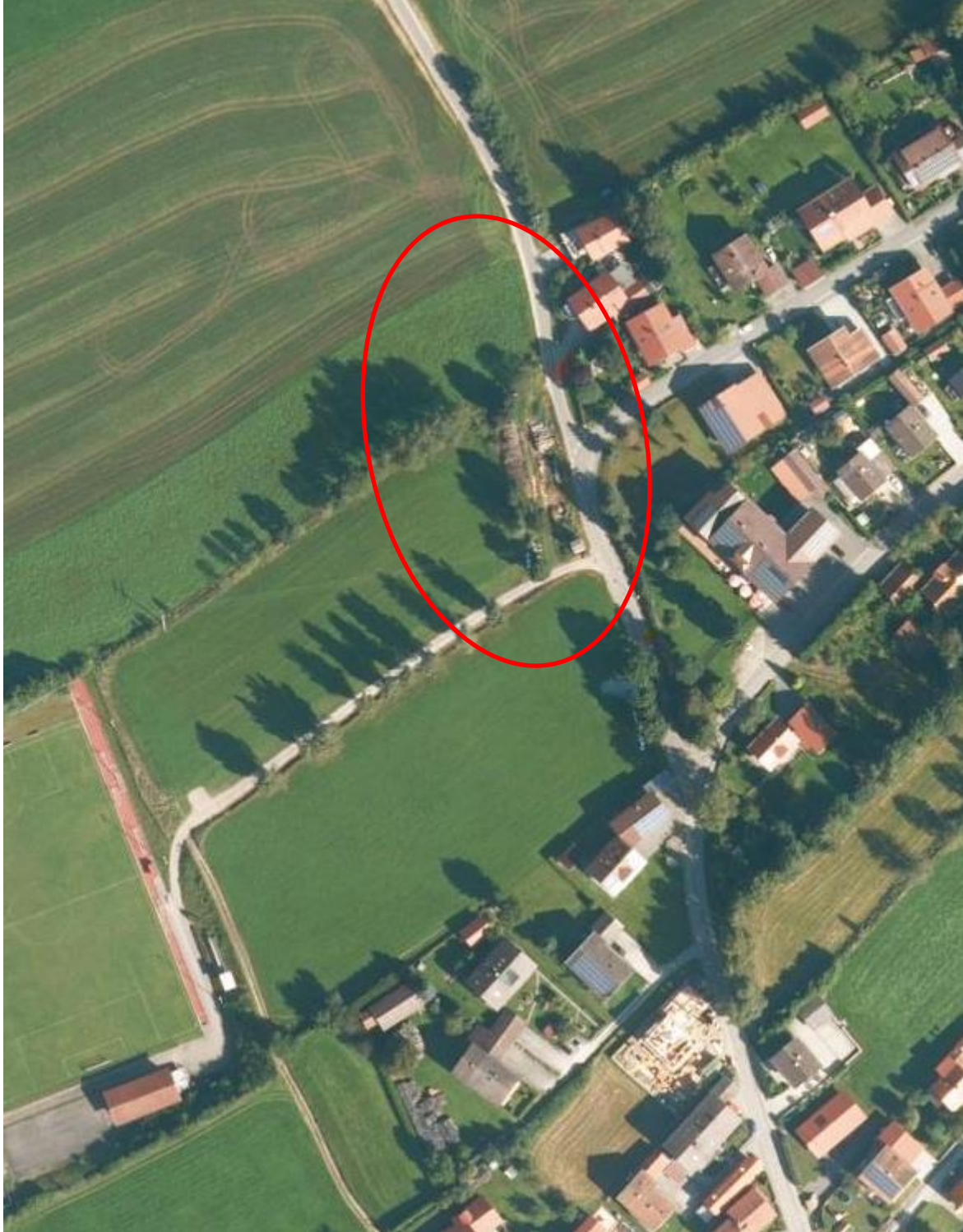
Abbildung 1 Luftbild, aus BayernAtlas